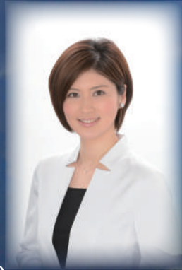
司会：鈴江 奈々 (日本テレビアナウンサー)